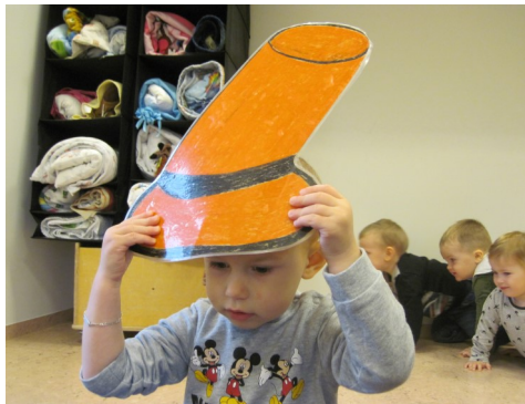
Sjáðu hattinn minn