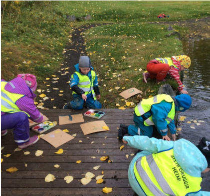
Málað úti í náttúrunni