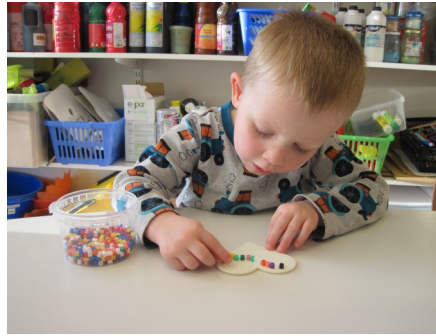
Perlað af hjartjans list