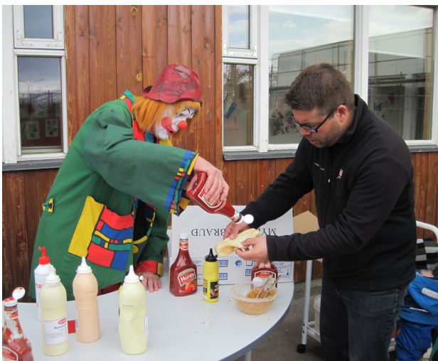
Skralli heimsótti okkur eftir sveitaferðina