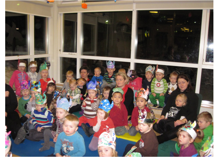
Söngfundur á Bóndadaginn 2013