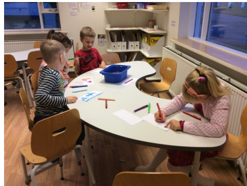
Vinakort útbúin í vinavikunni