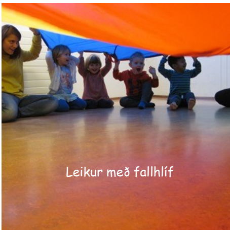
Leikur með fallhlíf