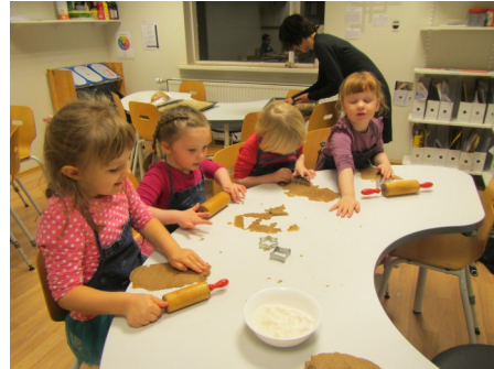
Bakstur fyrir jólin