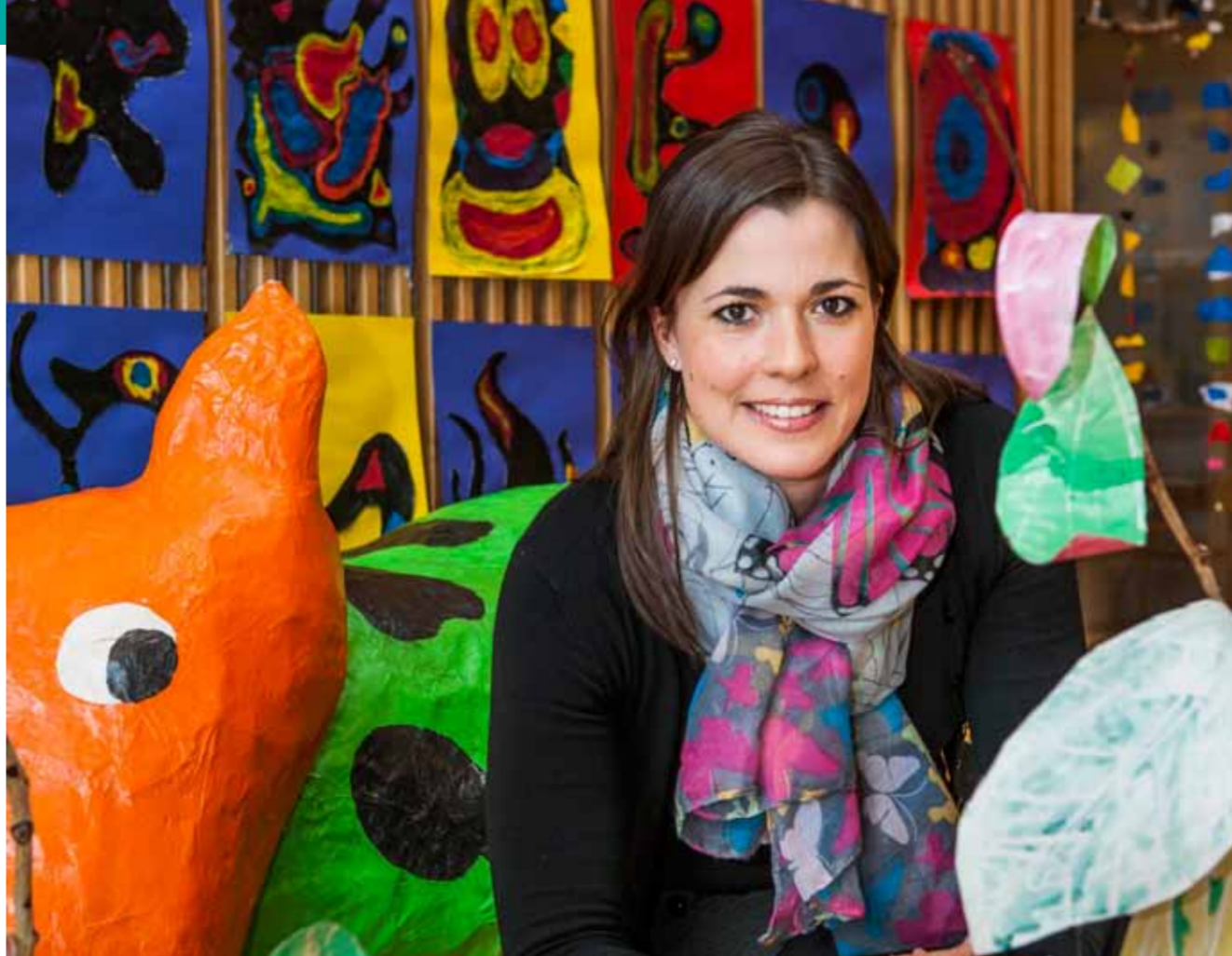
Hrafnhildur Sigurðardóttir: „Í þeim er kennarinn ekki með fyrirfram ákveðna hugmynd um hvernig hlutirnir eiga að vera.“