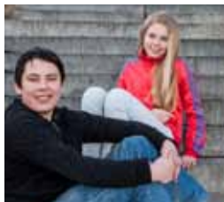
Vallaskóli bls. 4