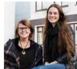
Tækniskólinn bls. 6