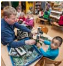
Leikskólinn Laugasól bls. 2